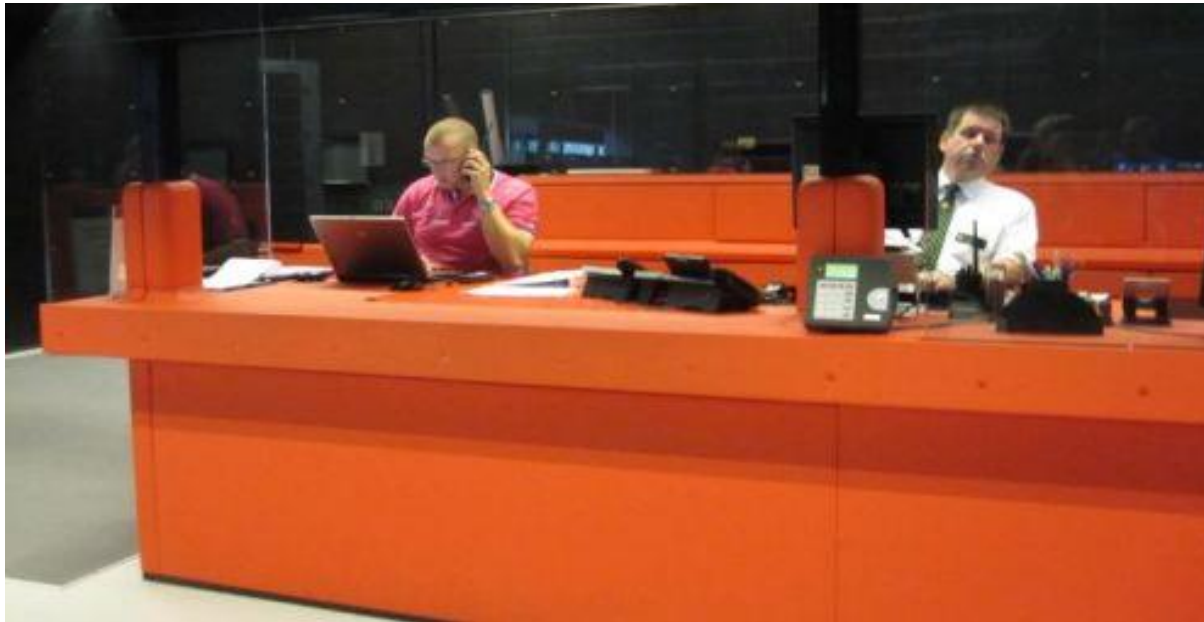
Aufsicht/Rezeption UB Utrecht, Uithof