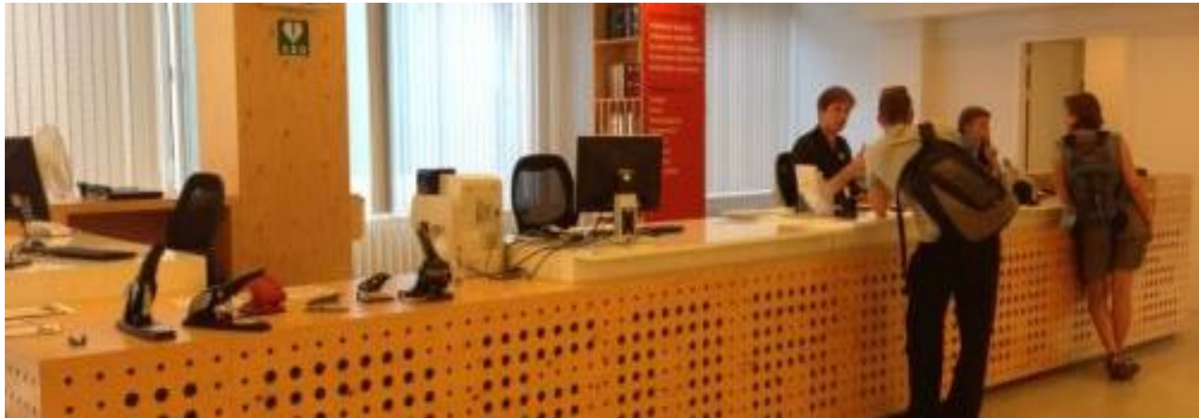
Infotheke UB Amsterdam