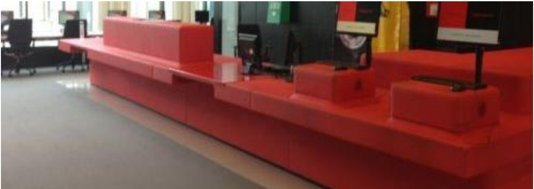
Ehemaliger Infotresen UB Utrecht, Uithof