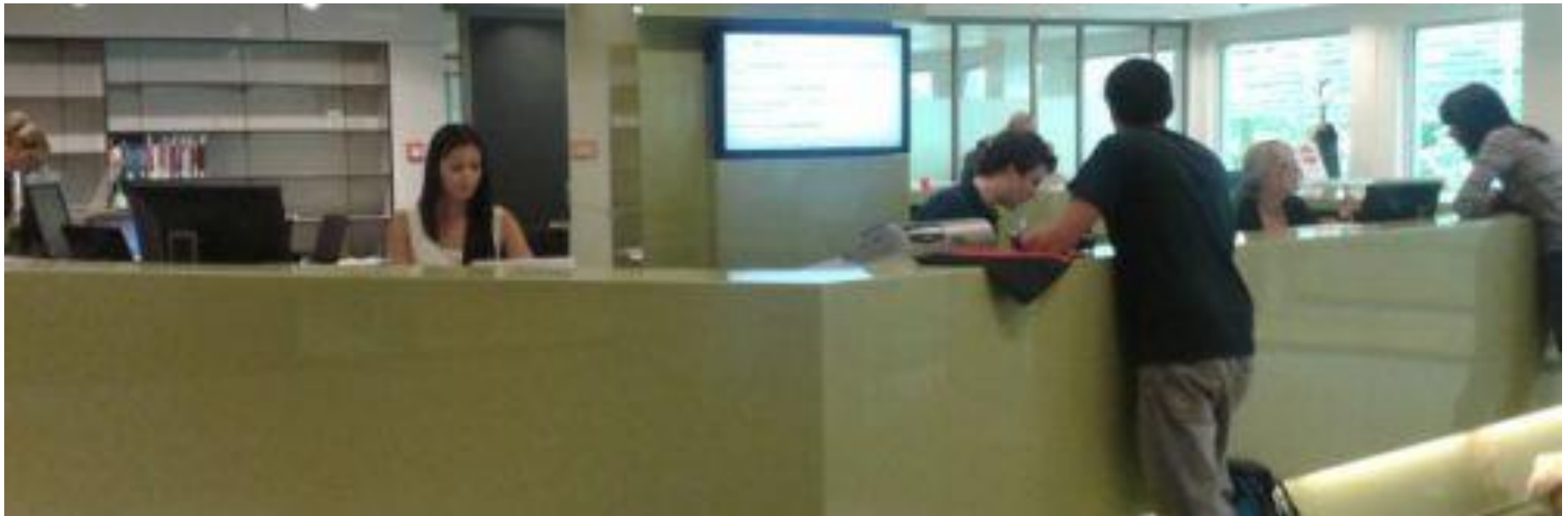
Infotheke UB Tilburg