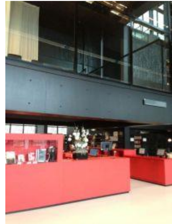
Infotresen und Abholregal UB Utrecht, Uithof