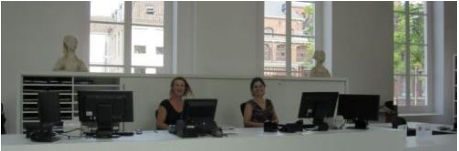
Infotheke UB Utrecht Binnenstad