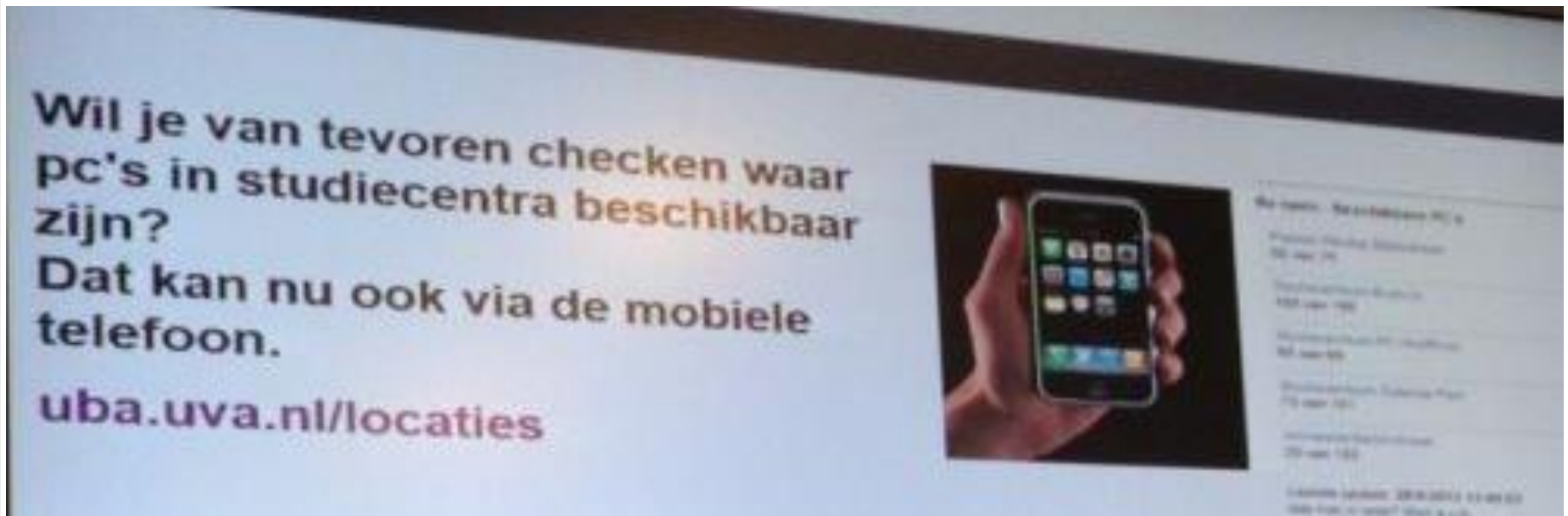
Info-Bildschirm UB Amsterdam